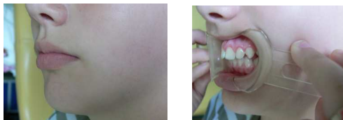
Exemple d'un enfant avec une classe 2 orthodontique en voie d'installation avec béance antérieure